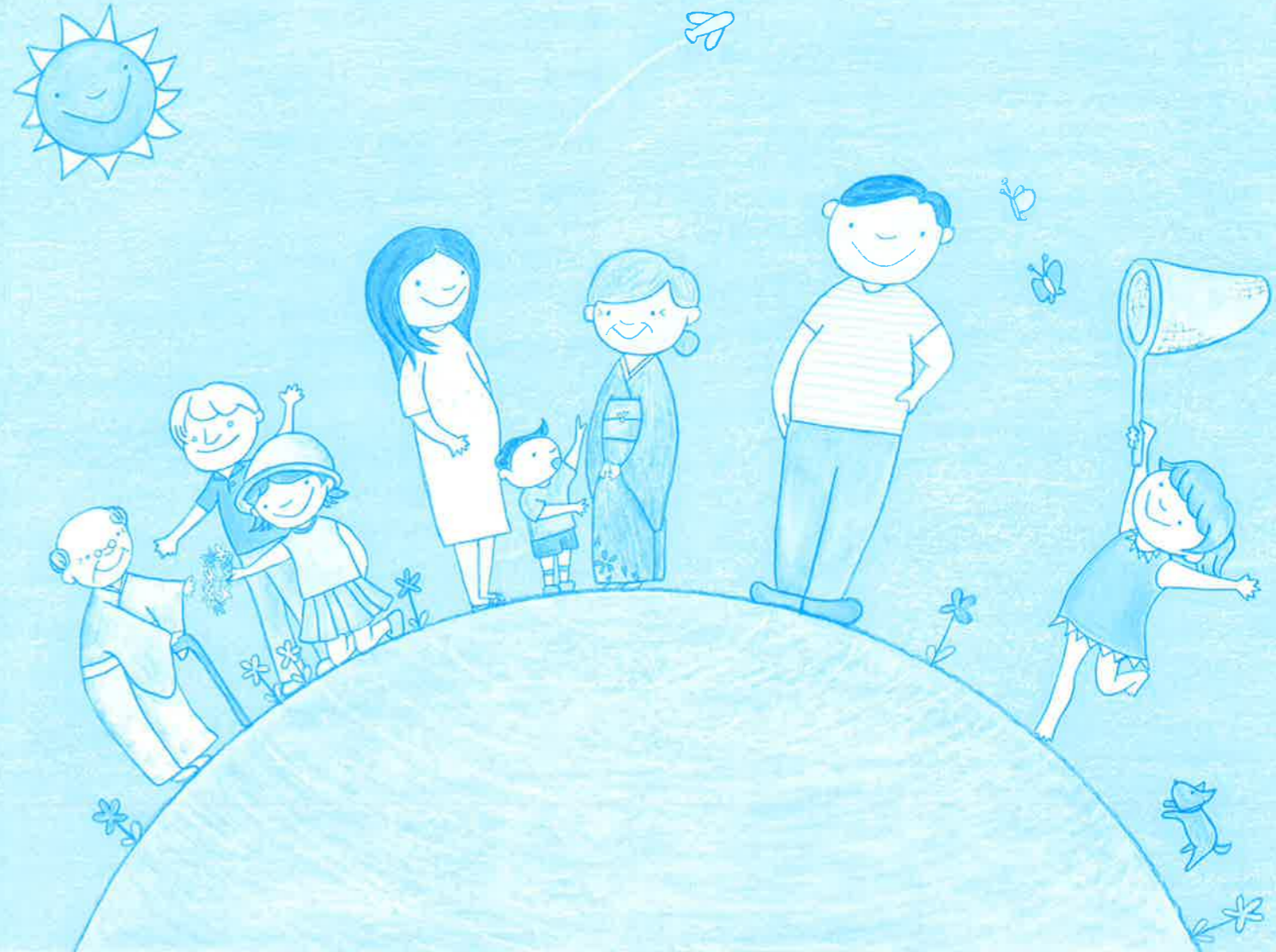
絵：京都市立銅駝美術工芸高校 デザイン専攻 2年 粟津友菜

日時 9/1(土)・2(日) 9:00~16:30 (2日は16:00まで) 入場無料